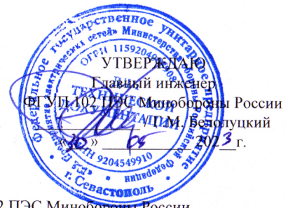
График работ ПУ №1, ПУ №2 и ЭТЛ на объектах ЭСХ ФГУП 102 ПЭС Минобороны России на июнь 2023 года по г. Севастополю