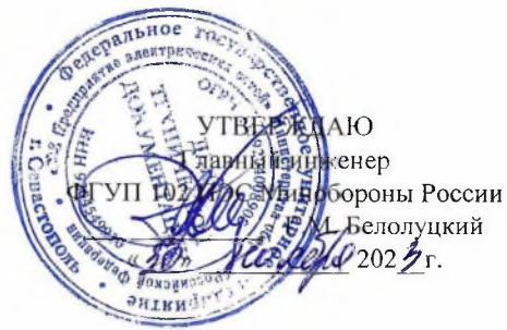
График работ ПУ №1, ПУ №2 и ЭТЛ на объектах ЭСХ ФГУП 102 ПЭС Минобороны России на декабрь 2023 года по г. Севастополю