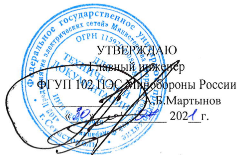
График работ ПУ №1, ПУ №2 и ЭТЛ на объектах ЭСХ ФГУП 102 ПЭС Минобороны России на август 2021 года по г.Севастополю