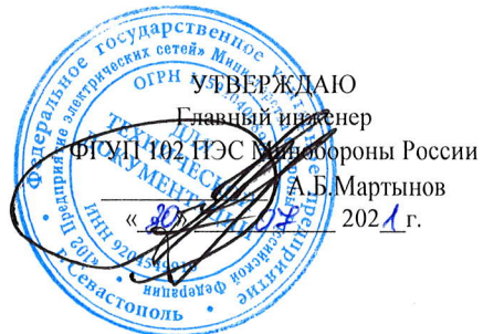
График работ ПУ №3 и ПУ №4 на объектах ЭСХ ФГУП 102 ПЭС Минобороны России на август 2021 года по Республике Крым