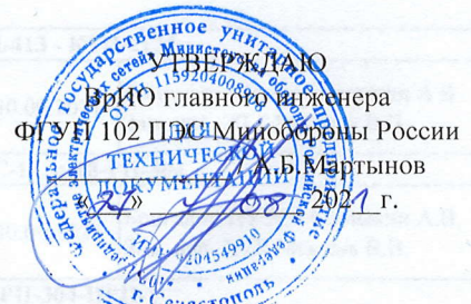
График работ ПУ №1, ПУ №2 и ЭТЛ на объектах ЭСХ ФГУП 102 ПЭС Минобороны России на сентябрь 2021 года по г.Севастополю