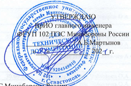
График работ ПУ №3, ПУ №4 и ЭТЛ на объектах ЭСХ ФГУП 102 ПЭС Минобороны России на сентябрь 2021 года по Респ. Крым